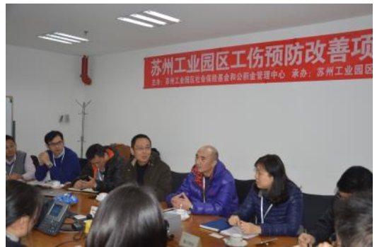
工作预防改善项目走进企业

走进企业的工伤预防改善项目，旨在通过行业专家点对点的现场走访以及针对性的风险培训，帮