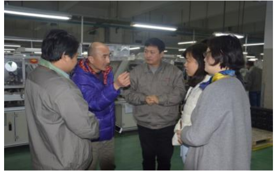
工作预防改善组专家深入企业生产现场

项目启动以来，到目前为止，预防改善项目组的专家们已陆续走进了星德胜电机、金红叶纸业等7家风险相对较大的大中型规模企业，受到了企业