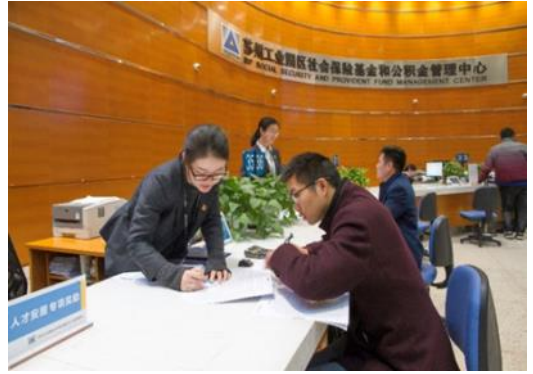
中心人才安居专窗