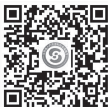
江苏人社官网手机版

江苏省人力资源和社会保障厅网上办事服务大厅（网址： https://rs.jshrss.jiangsu.gov.cn/ ）