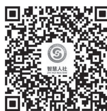
江苏智慧人社微信小程序

江苏省医疗保障局网上办事服务大厅（网址： http://ybj.jszwfw.gov.cn/ ）