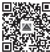
园区社保和公积金微信公众号