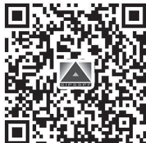
园区社保和公积金中心网站

苏州工业园区社会保险基金和公积金管理中心（网址： http://www.sipspf.org.cn ）